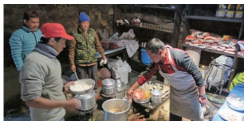
▲頼もしいキッチン・スタッフ