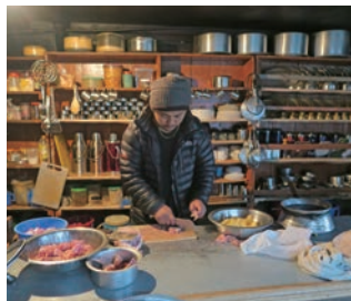
▲腕を振るう専属コック