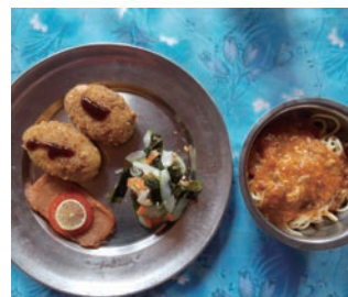
▲クラシック・スタイルの昼食例