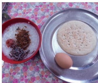
▲クラシック・スタイルの朝食例

グループ・トレッキングに対して、十分な食事の提供が可能なロッジが不足しているコースや、長期間にわたるコースでは、コック1名、アシスタントコック1名、キッチンボーイ数名からなる専属のキッチン・スタッフがトレッキングの期間すべてに同行し、毎食、グループのためだけに工夫を凝らしたお食事を提供します。