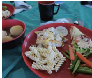
▲クラシック・スタイルの夕食例