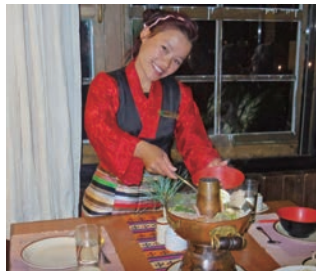
▲ロッジのスタッフ