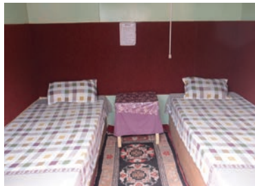
▲平均的なロッジの部屋