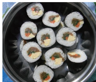
▲クラシック・スタイルの昼食例