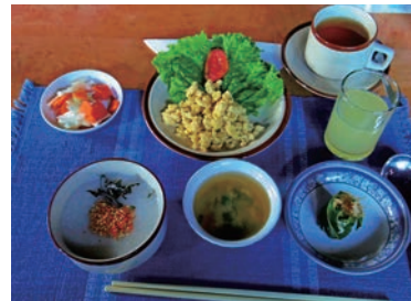
▲最高級ロッジ朝食一例