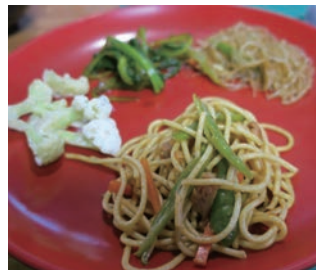
▲クラシック・スタイルの夕食例