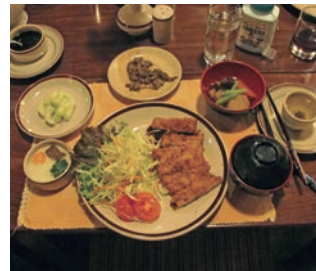
▲最高級ロッジの夕食一例