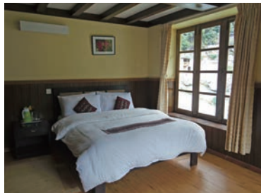
▲快適で清潔なベッド