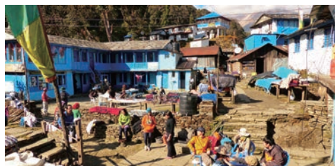
▲平均的なロッジの外観