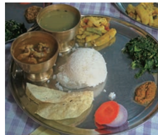
▲平均的なロッジの夕食(ネパール定食)