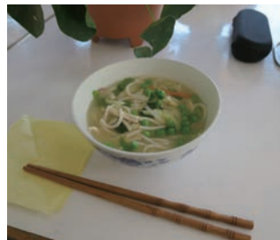
▲平均的なロッジの昼食