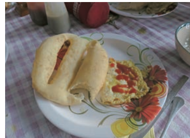
▲平均的なロッジの朝食