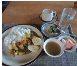
▲最高級ロッジ昼食一例