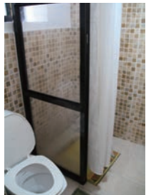
▲部屋ごとの専用シャワーとトイレ

トレッキングコース沿いに整備されてきたトレッカー向けのロッジの中には、特別に調理のトレーニングを受けたプロの料理人が調理した食事を提供するロッジがあります。そんな厳選ロッジに宿泊するコースでは、当社専属のコックは同行しませんが、バラエティ豊富な食事が提供されます。