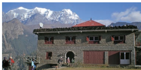
▲ナウリコットのロッジからニルギリ連峰を望む